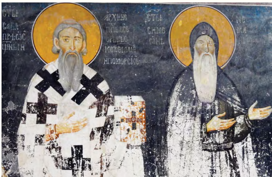
Св. Сава и Св. Симеон

Напослетку, сви заједно треба да се радујемо што ћемо ускоро у Београду, после молитве у довршеном и величанственом Храму Светог Саве на Врачару, моћи да прошетамо лагано Не-