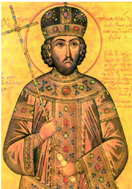
Св. цар Константин Велики

Под раном хришћанском Црквом подразумијева се хришћанство у периоду послије Силаска Св. Духа на апостоле (у раним тридесетим годинама нове ере), па све до Миланског едикта 313. године. Након Силаска Св. Духа на апостоле и након чувене бесједе Св. апостола Петра истог дана, крстило се око 3000 људи (Дап. 2, 41). То је била прва црквена заједница. Послије овог догађаја, апостоли су кренули у снажну мисионарску дјелатност и број првих хришћана у Јерусалиму се свакодневно умножавао. „И сваки дан бијашу истрајно и једнодушно у храму, и ломећи хљеб по домовима, примаху храну с радошћу у простоти срца, хвалећи Бога, и бијашу омиљени код цијелог народа. А Господ сваки дан додаваше Цркви оне који се спасаваху “ (Дап. 2, 46-47). У самом центру живота првих хришћана била је Св. Литургија (Причешће). Она је била тај огањ који је полако разбуцтавао пламен апостолске мисије по цијелом свијету. Након Јерусалима, св. апостоли су се отиснули у свијет гдје су неуморно проповиједали Јеванђеље, поучавајући и крстећи људе у име Оца, Сина и Светога Духа. Убрзо, у готово цијелом познатом тадашњем свијету основане су нове заједнице вјерних. У то вријеме велика мисија је извршена код паганских народа који су говото сви припадали грчко-римском културном миљеу. И даље је један приличан број хришћана долазио из јудаизма, међутим, тежиште хришћан-