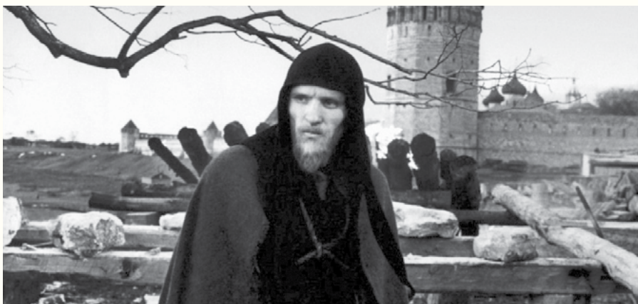
Сцена из филма - Андреј Рубљов

„Чини ми се да појединац данас стоји на раскршћу, суочен са избором да, или настави са новим технологијама и бескрајним умножавањем материјалних добара, или да пронађе пут који ће водити духовној одговорности, пут који би на крају могао значити не само његово лично