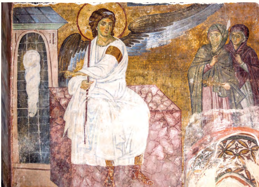
Бели анђео - манастир Милешева

но учење о анђелима и другим духовима, треба најпре заборавити сувише упрошћену савремену дихотомију између материје и духа: истина је сложенија, и у исто време тако једноставна да ће онога ко је још способан да верује у њу вероватно многи сматрати „наивним буквалистом“.