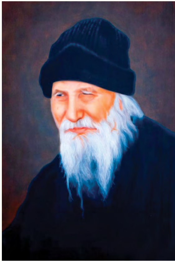
Старац Порфирије Кавсокаливит

пруга се пре неколико година озбиљно разболела – нашли су јој рак. Лекари су јој дали само три месеца живота. У исто време мој син је завршавао лицеј и казао нам је да се дечаци из његовог разреда спремају да посете Свету Гору. Дали смо му дозволу и момчићи су отишли на Атонску Гору. Међутим, мојој супрузи је постало много горе. Њен доктор који ју је лечио рекао је да је то последња фаза болести и да је крај веома близу. Са великом узнемиреношћу упитао сам лекара: „Шта је могуће да се уради да би јој се бар још мало продужио живот?“ – „Урадићемо још једну операцију и Бог нека нам је у помоћи“ – закључио је доктор. Ипак,