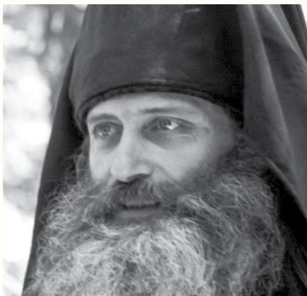
о. Серафим Роуз

једу (Пост. 18 и 19 гл. ). На сличан начин Свети Кирил Јерусалимски у својим „Катихетским беседама“ поучава нас у вези са анђелом који се јавио пророку Данилу: „Видевши анђела Гаврила, Данило се престрави и паде ничице, и премда беше пророк, не осмели се да му одговори док анђео не узе на себе обличје сина човечијег“ („Катихетске беседе“ IX, 1). Ипак, у Књизи Даниловој