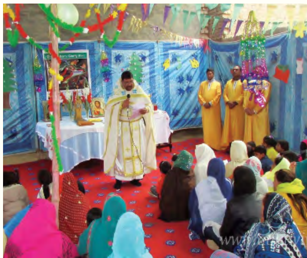
Богослужење у Пакистану