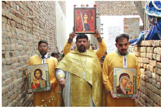
Крсни ход са иконама

– У добром смо односу и са римокатолицима и са локалним католичким епископом. Са протестантима нису тако топли односи. Имамо и православне који су из протестантских породица, и уколико је тамо неки догађај, свадба или сахрана и нас наравно зову. Но у глобалу, немамо блиске односе са протестантима. Иако обични људи не придају посебан значај конфесионалним