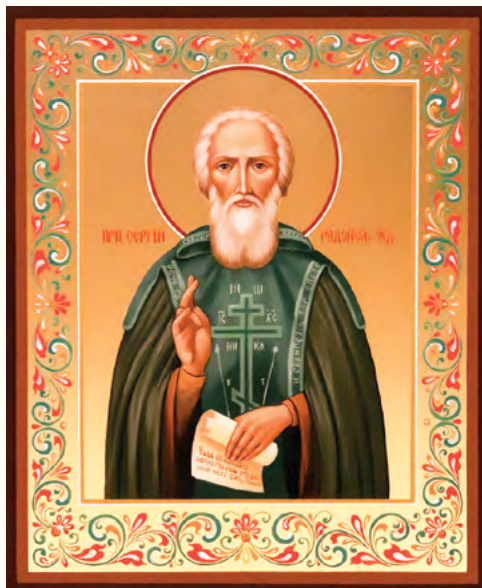
Св. Сергије Радоњешки

Господа и са Господом. Господ Исус Христос сам у Светом Писму говори: „Јарам је мој благ и бремен је моје лако“ (Мт. 11, 28-30). Ипак, до дана данашњег стоји и да се Царство Божије „са напором осваја“ (Мт. 11, 12). Сви ми, без изузетка, желимо и чезнемо за спасењем. Свако од нас, православних хришћа-